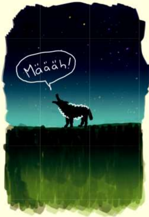
„DER WOLF IM SCHAFSPELZ“ Gefahren erkennen und vorbeugen

Religiös-weltanschauliche Sondergruppen sind immer wieder Thema in den Medien und ein bleibendes Problem in unserer Gesellschaft. Viele Menschen haben den Wunsch nach religiöser Zugehörigkeit und sinnstiftenden Beziehungen. Dieses verständliche Bedürfnis kann leicht ausgenutzt werden. Entsprechende Gruppen treten unter den verschiedensten Namen und Bezeichnungen auf und lassen ihre eigentlichen Ziele oftmals nicht auf Anhieb erkennen.