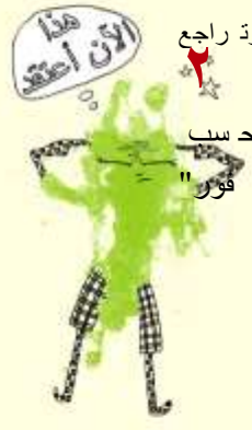
تصميم: د. محمد عبد الرحمن عبد الرحمن

لوع اني لادمن" الافال الشعار م تاما حسب الفور