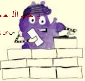
تصميم: د. محمد عبد الرحمن عبد الرحمن

من عن بقرية العامل خاصة تخلف غري عادية. يجب اتباع جميع القواعد دون قيود أو شروط.