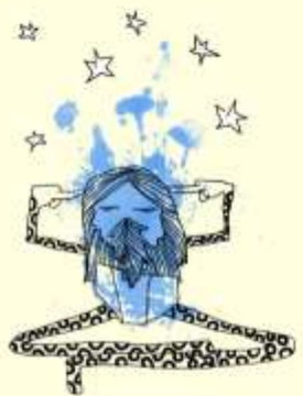
تصميم: د. محمد عبد الرحمن عبد الرحمن

الذي ميالك الحدقة بقرية كام يجب اتباع مخالفةت عدل يامته حتى وإن بدت للقانون أو غري منطقية.